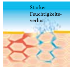
Lipidverlust führt zu einer gestörten Hautbarriere: Die Haut verliert viel Wasser und trocknet aus.